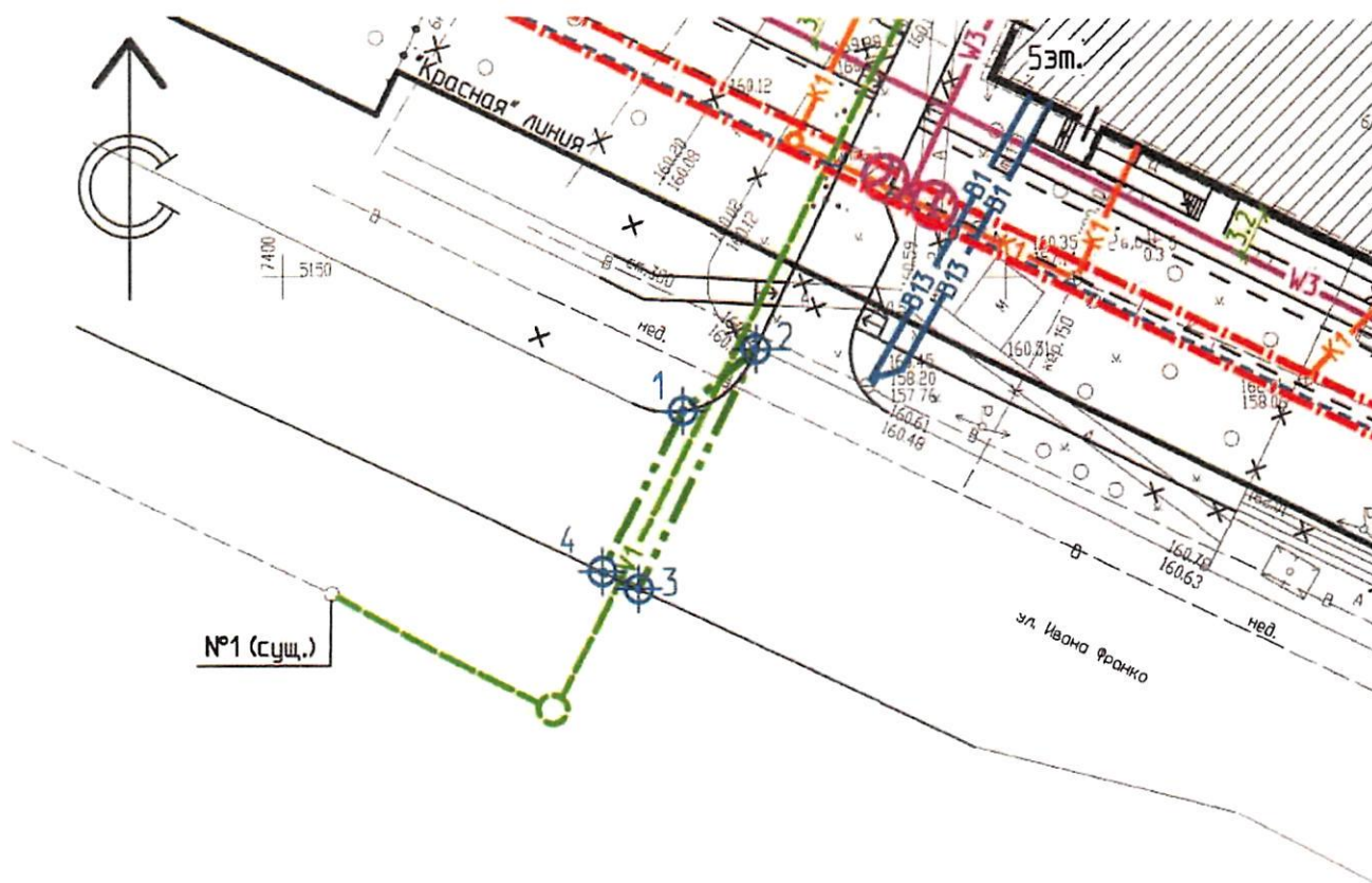
Каталог координат (система координат г. Перми)

Вид разрешенного использования: линии связи, линейно-кабельные сооружения связи и иные сооружения связи, для размещения которых не требуется разрешение на строительство